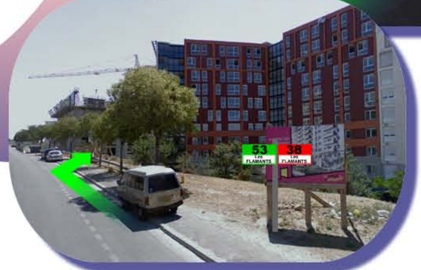
Un peu de marche...